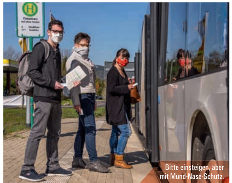
Bitte einsteigen, aber mit Mund-Nase-Schutz.

» Ein normaler Linienbus hat bis zu 95 Plätze.«