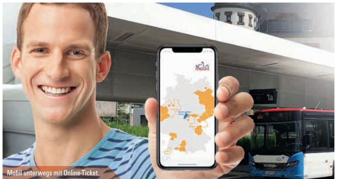
Mobil unterwegs mit Online-Ticket.

Mehr Informationen: www.wartburgmobil.info » Tickets » Online-Ticket