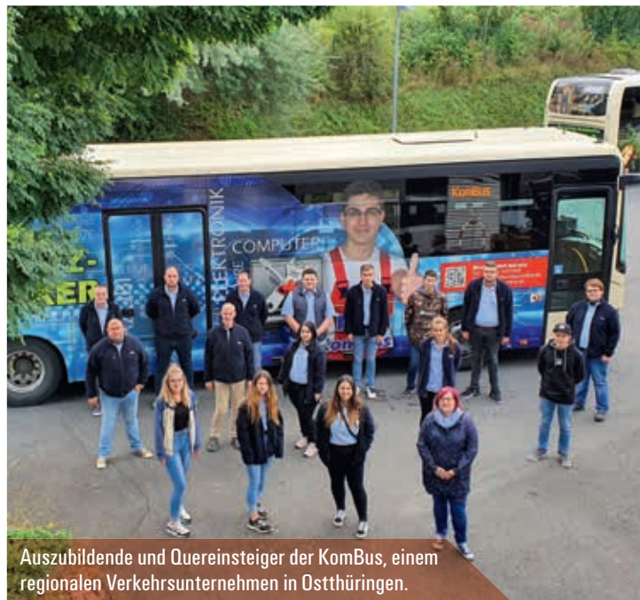
Auszubildende und Quereinsteiger der KomBus, einem regionalen Verkehrsunternehmen in Ostthüringen.

»Busfahrer ist ein verantwortungsvoller und abwechslungsreicher Job.«