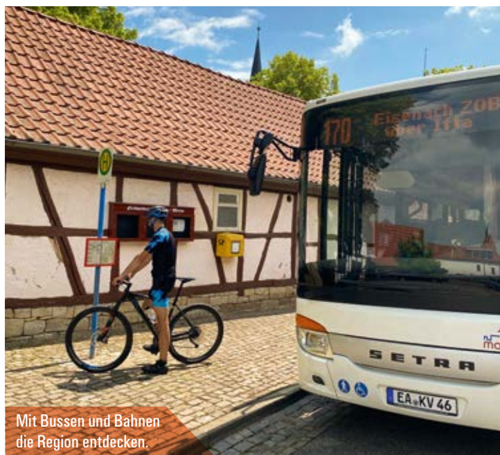
Mit Bussen und Bahnen die Region entdecken.

Die Verkehrsgemeinschaft Wartburgregion (VGW) beteiligt sich wieder an der Gemeinschaftsaktion von Thüringer Busunternehmen. Für nur einen Euro können Fahrgäste den ganzen Tag mit Linienbussen fahren. Fahrscheine gibt's beim Busfahrer.