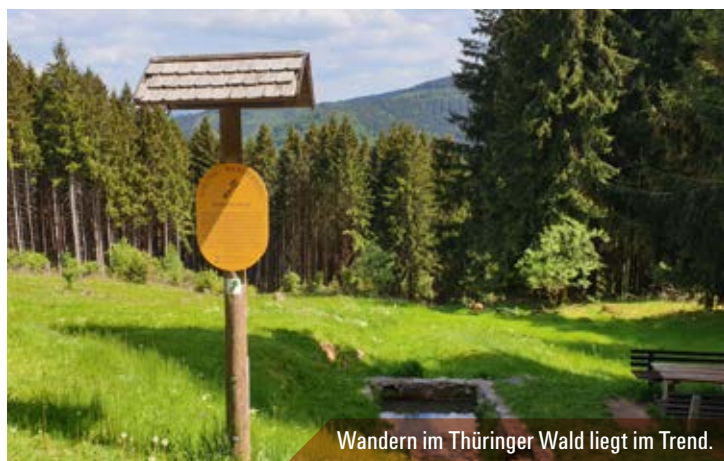
Wandern im Thüringer Wald liegt im Trend.

» Linienbusse fahren im Stunden- bzw. 2-Studentakt. «