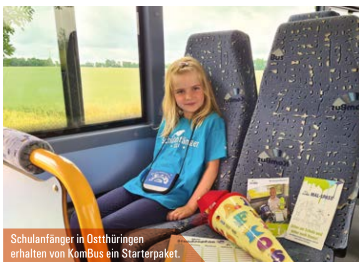
Schulanfänger in Ostthüringen erhalten von KomBus ein Starterpaket.

» Wir sind auf den Schulbeginn gut vorbereitet. «